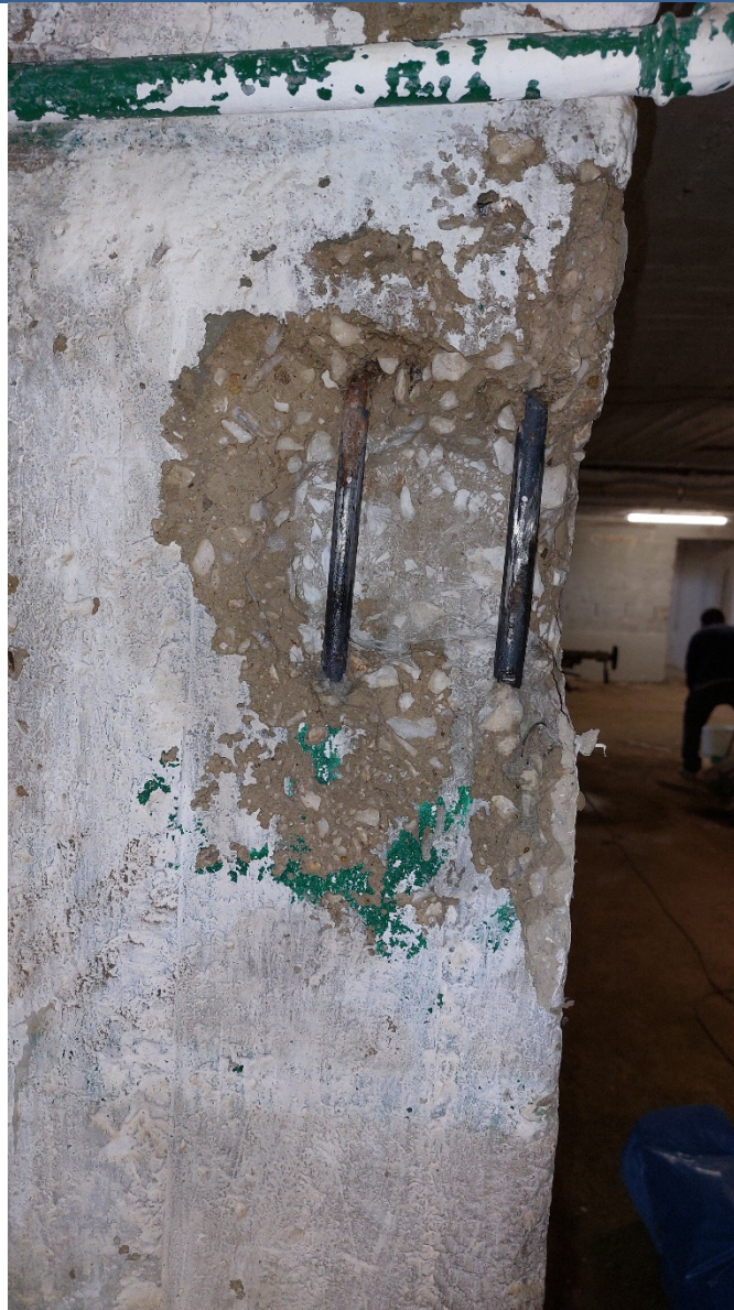
1. Καθαρισμός σπλισμών