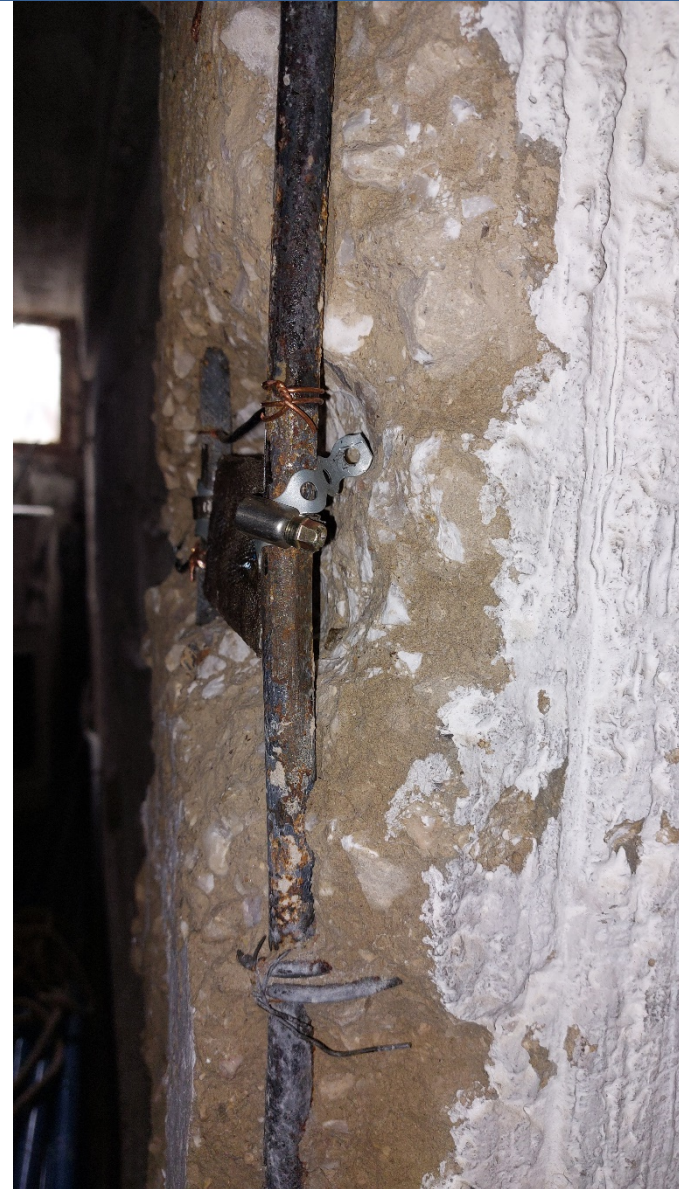
4. Σύνδεση οπλισμών με καλώδιο και τοποθέτηση Ανοδίου