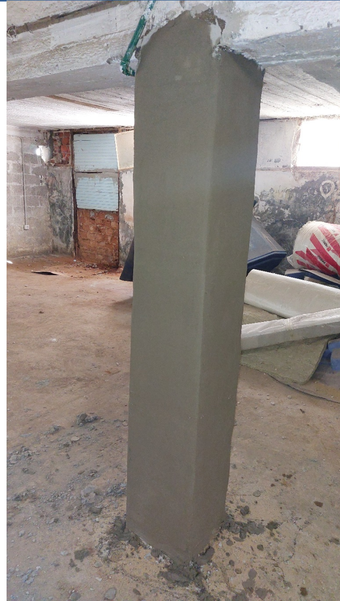
10. Επίστρωση υποστηλώματος με επισκευαστικό κονίαμα R4