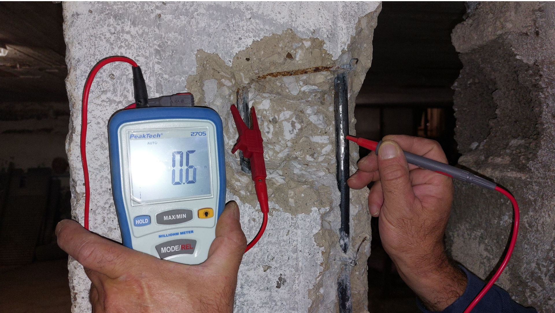
2. Έλεγχος ηλεκτρικής σύνδεσης σπλισμών