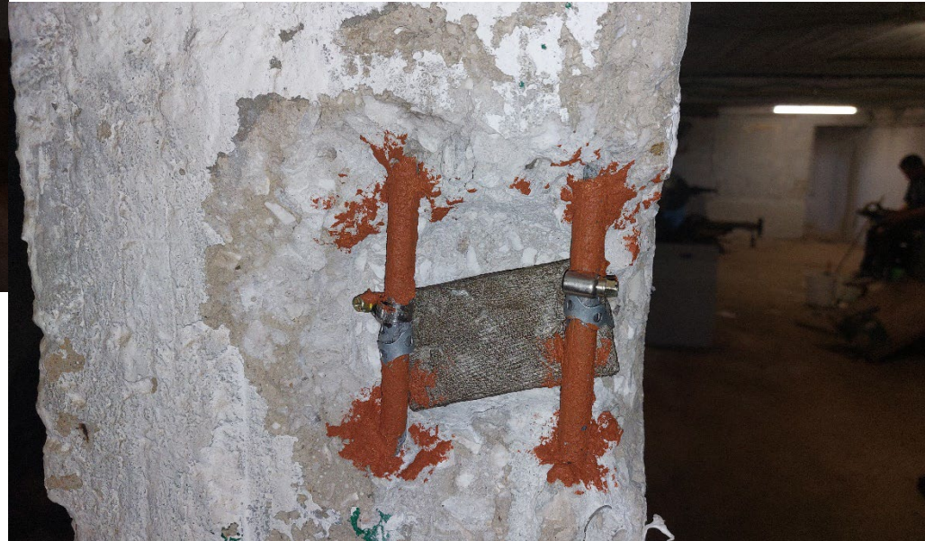
5. Τοποθέτηση Ανοδίου