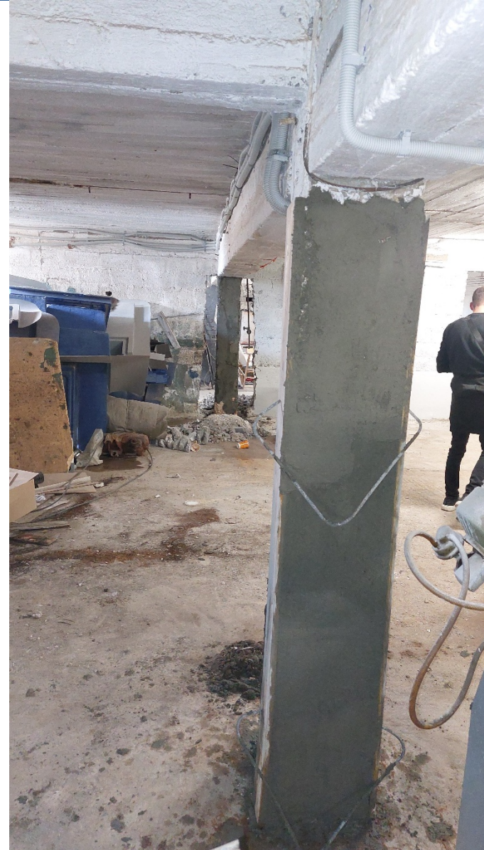
9. Αποκατάσταση διατομής του υποστηλώματος με επισκευαστικό κονίαμα R4