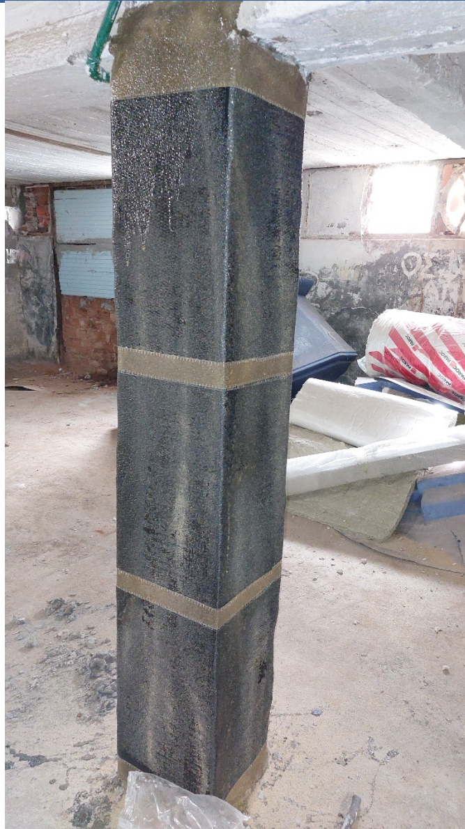
12. Επίταση χαλαζιακής άμμου