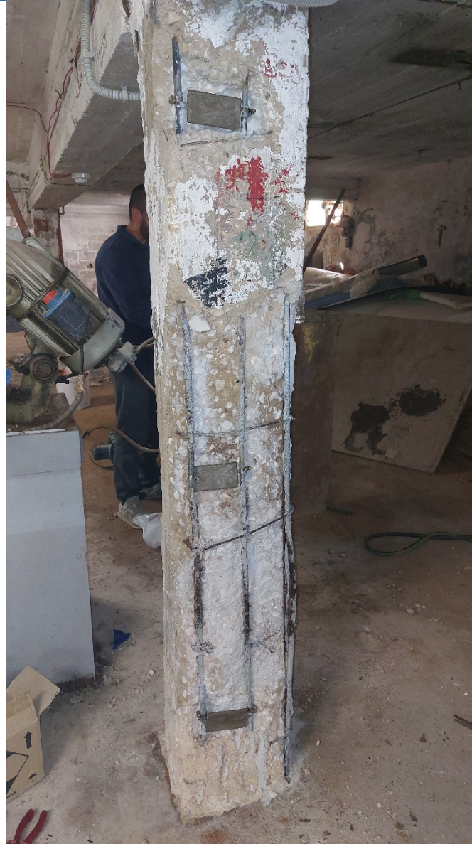
6. Τοποθέτηση Ανοδίων στην μία πλευρά του υποστηλώματος