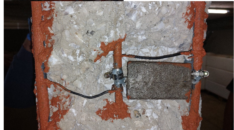
8. Διαβρωτική προστασία οπλισμών