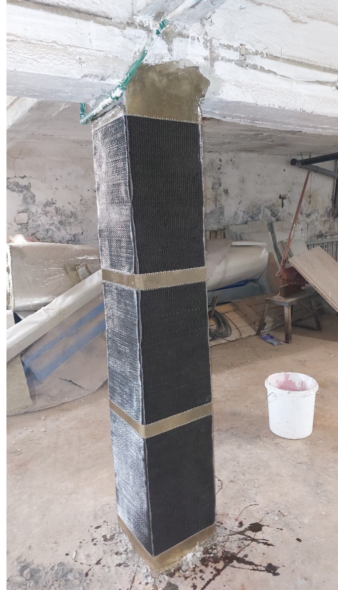
11. Ενίσχυση υποστηλώματος με FRP