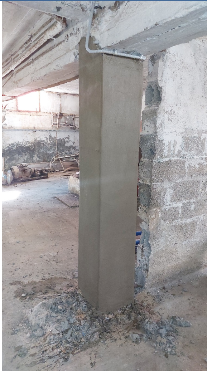
13. Προστασία FRP με μια στρώση λεπτόκοκκου επισκευαστικού κονιάματος R4