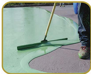
ΑΚΡΥΛΙΚΗ ΡΗΤΙΝΗ ΜΕ ΚΑΟΥΤΣΟΥΚ