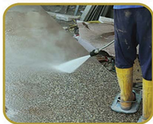
ΕΠΙΒΡΑΔΥΝΤΙΚΟ ΥΛΙΚΟ ΓΙΑ ΤΗ ΔΙΑΜΟΡΦΩΣΗ ΕΠΙΦΑΝΕΙΩΝ